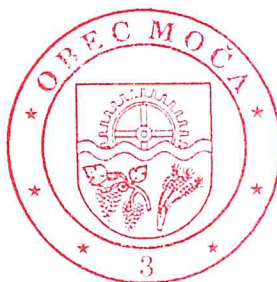
Ing. Tóth Eszter polgármester