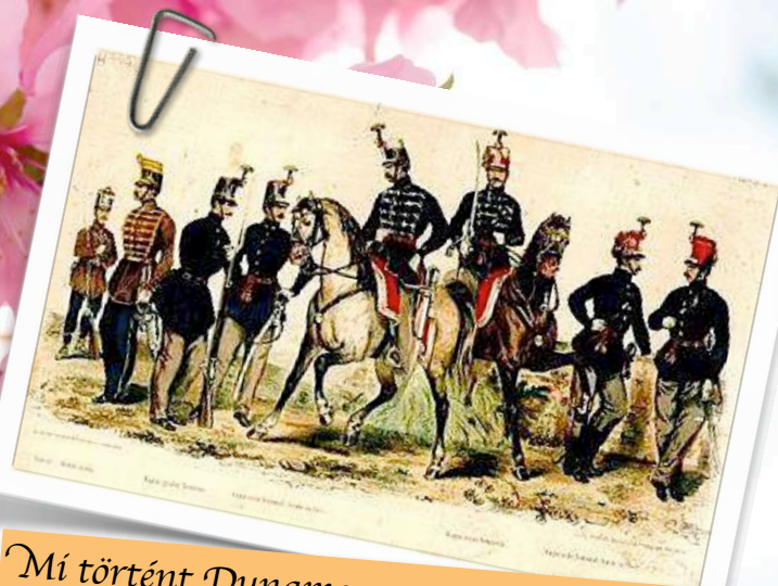
Mi történt Dunamocson 1848-49-ben? 3. oldal