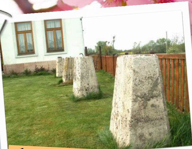
Ha a kövek mesélni tudnának 5. oldal