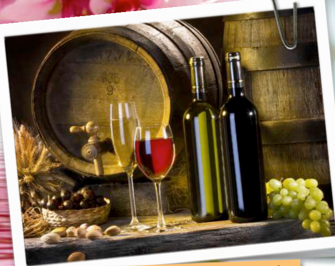
A borverseny eredményei 8. oldal

Havonta megjelenő közéleti lap. Kiadja Dunamocsi község önkormányzata. Szerkesztő: Rácz Kálmán PhD. Telefon: 0905 970 976.