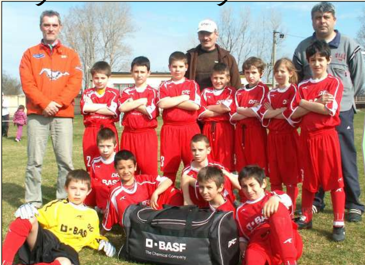
A kölyökcsapat az új szerelésben, előtérben a táska, amely a másik garnitúrát tartalmazza.