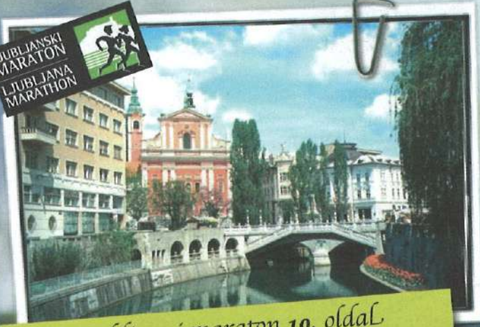
Ljubljanaí maraton 10. oldal