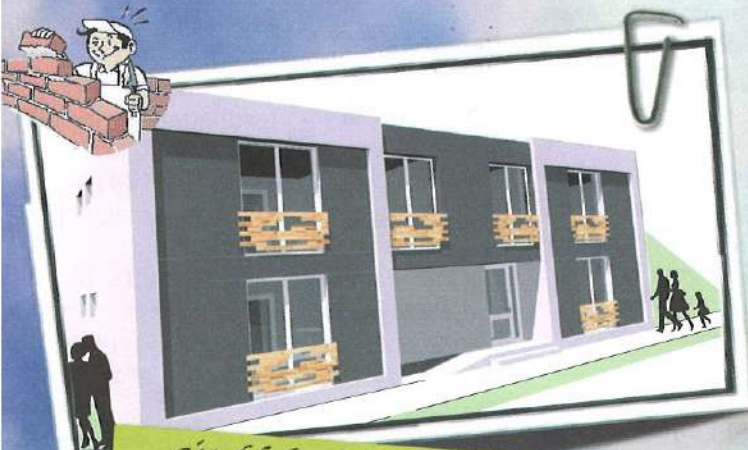
Újabb bérlakás épülhet 6. oldal