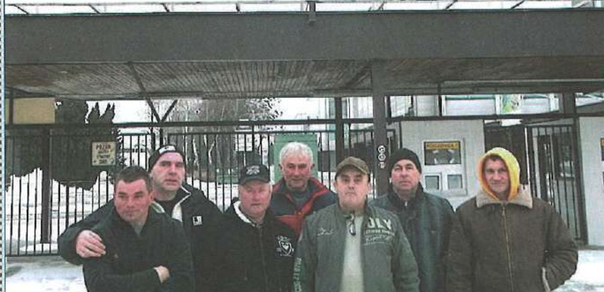
A két kép éppen 30 év különbséggel készült, 1983-ban Prágában és 2013-ban Nyitrán.