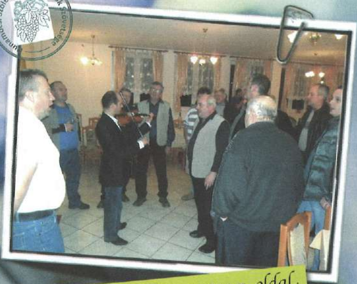
11. Dunamocsi Bormustra 7. oldal