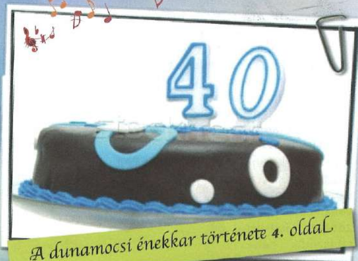
A dunamocsi énekkar története 4. oldal